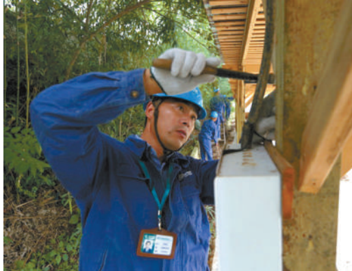
宁海农家乐:用电无忧迎“双节”

为迎中秋、国庆,国网宁海供电公司安全巡查小分队来到了宁海前童古镇、岔路镇,分别对前童农家、紫竹园、乾溪山庄、大湾山寨进行用电安全巡查。同时,向农家乐经营者和员工普及安全用电、节约用电常识,并主动征求供电服务的意见和建议,确保农家乐用电无忧,为宁海旅游经济发展提供安全、可靠的电力保障。