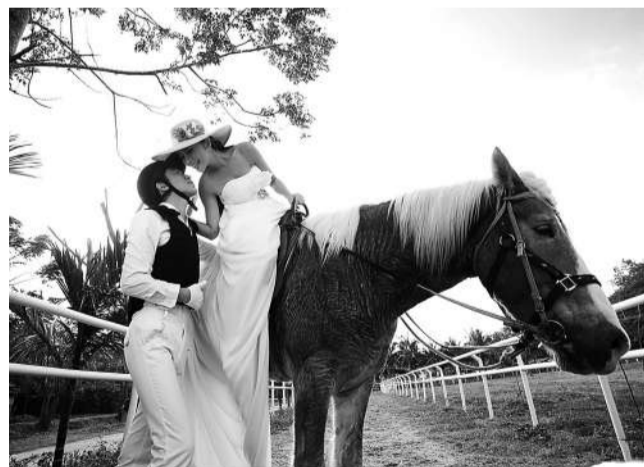
18世纪,法国人“发明”了爱情。浪漫骑士之爱其实是精神的出轨。图为资料照片。

女人肯定思考:如果无关爱情,无关终身厮守,为什么还要结婚?如果不需要对男人有经济依赖,为何还要勉强自己委曲求全,为了家庭做出牺牲呢?西方在经历了20世纪中期的性解放高潮之后,重新开始寻觅传统家庭的价值。亚龙在她最新的考察中就发现,美国大多数女性仍然愿意进入婚姻,渴望建立被社会认可的、有制度保障的夫妻关系。婚姻的社会功能和内在动力发生了改变,但它依然是至今为止人们最愿意安放身心的栖居之地。女人恐婚,害怕的不是婚姻,而是附加其上的枷锁。“不管是妻子、配偶、伙伴、伴侣或情人,无不渴望得到另一半的承诺,共享一种深刻的关系。”如何实现婚姻的公平性和灵活性,这才是亚龙所说的“迈向新妻子”的关键。