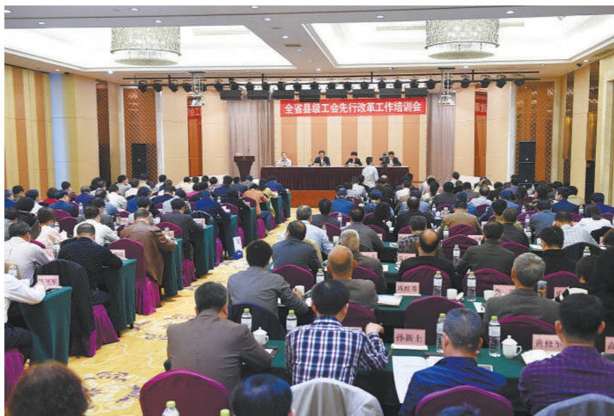
昨天, 全省县级工会先行改革工作培训会在宁波举行。