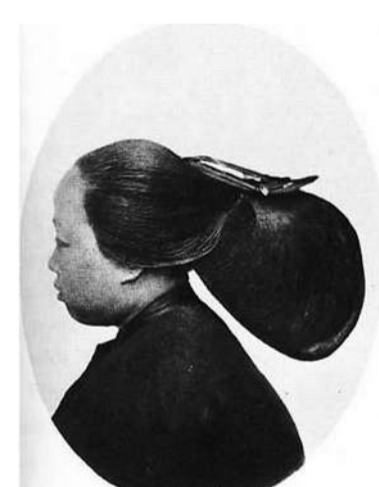
宁波妇女,在没有摩丝的年代,能把头发梳成这样十分不易,这种扫帚式发型即使在今天也可以算是相当前卫。

有的则折射出服饰审美观念的变迁。有些老话描述的打扮,在过去,宁波人是持反对态度的,现今却比比皆是,而且正在成为一些流行的现象,最典型的莫过于“长袍短套”——短袍内穿长裤,如今正成为一代潮流,就是所谓“打底裤”,如今堂堂而皇之横扫当今大街小巷;而那些“红裙绿夹袄”的“俗气”配色,“李太君婆”式的不配套,也已经见怪不怪了,因为这可以被叫做“混搭”,如今正引领着时尚。