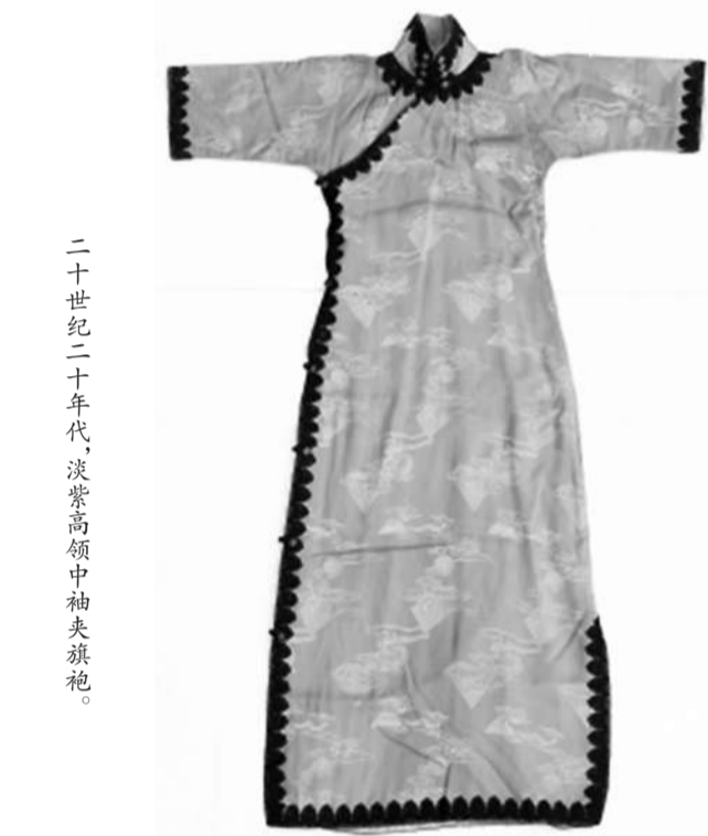
二十世纪初二十年，淡紫高领中袖旗袍。