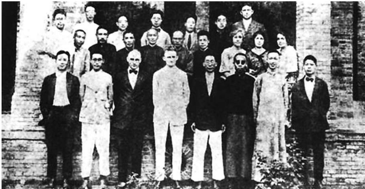
1915年效实中学教员合影，西装革履与长袍马褂一起并不违和。