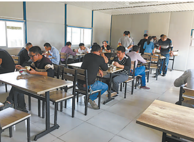
员工就餐。

从食堂外头看,这就是个普通的工棚。沿路挂满了安全宣传画,用工作人员的话说,“哪怕是来吃饭的途中看一眼,只要能起到安全提醒作用,也是好的。”进入食堂内部,每一副碗筷都整齐地摆放在储物柜,简单、干净、有序,是记者最直观的感受。 取菜窗口旁的公示栏格外引人注目,上面贴着每月定期公布的伙食监督情况。内容包括开支、食堂卫生、食堂纪律、饭菜质量等。例如,4月份的公告就清清楚楚地写明了伙食费用支出,并依次写明了“伙委会”主任、“伙委会”成员的名字,做到公开、透明。(下转第4版)