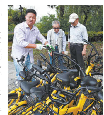
5月24日,在工人师傅搬运受伤的单车时,两位路过的老人目睹现场痛心不已,呼吁人们一定要爱惜公物啊。

“詰詰”、“陌上花开”、“又见花海”等不少网友在同声追问文明去哪儿了的同时也建议,对于那些随意破坏共享单车的行为,要用法律手段来制止!