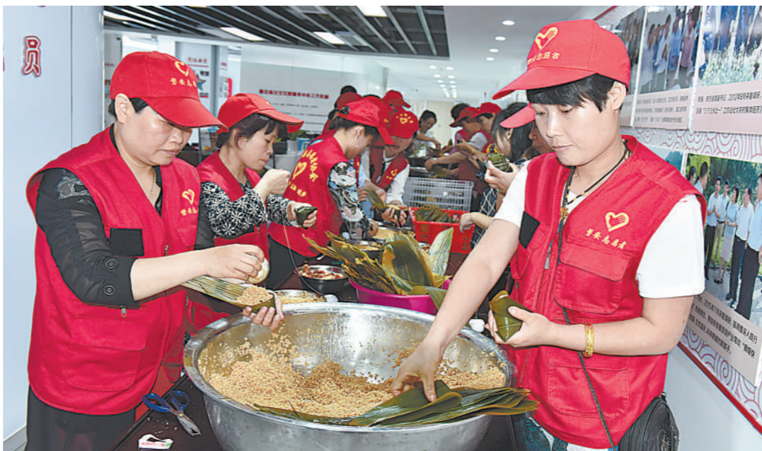
在端午节来临之际,磐安县爱心公益团的志愿者们包了800多个肉粽,送给全县68位老兵和8家村级居家养老中心,让老人们感受到社会的关爱,快乐地迎接端午佳节。图为5月25日,20多名志愿者在包爱心粽子。