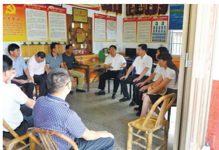
“小板凳”职工议事会。