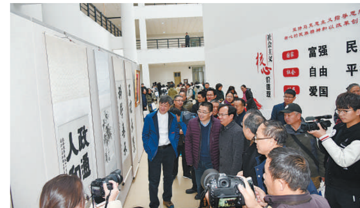
第四届浙江省教职工书画展现场

本报讯 记者杜成敏 通讯员李岍报道 12月12日,由省教育工会主办,省教育书法协会、浙江大学宁波理工学院、省书法家协会教育委员会承办的“纪念改革开放四十周年·墨润之江”——第四届浙江省教职工书画展,在浙江大学宁波理工学院开幕。在浙江大学宁波理工学院开幕。在浙江大学宁波理工学院开幕。在浙江大学宁波理工学院开幕。