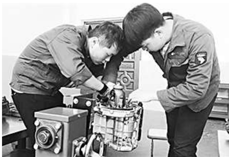
诸暨技师学院第四届技能运动会上,学生正在专心拆装汽车变速器。

2018年,现代学徒制人才培养模式的试点合作,正持续打通人才培养供给侧和需求侧之间的通道,在聚焦职业教育机制改革、深化产教融合方面继续迈出坚实步伐。