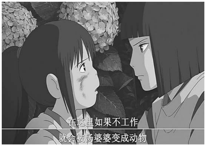
在这里如果不工作 就会被汤婆婆变成动物

单位应当保障劳动者享有劳动权利。汤婆婆强迫小镇居民劳动的行为,具有“以暴力、威胁或者限制人身自由的方法强迫他人劳动”的特征,涉嫌强迫劳动罪。按照我国《刑法》第二百四十四条,单位犯强迫劳动罪的,对单位判处罚金,并对其直接负责的主管人员和其他直接责任人员,处三年以下有期徒刑或者拘役,并处罚金;情节严重的,处三年以上十年以下有期徒刑,并处罚金。