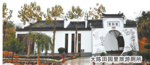
大陈田园里旅游厕所

2017年起,“全球免费游江山”活动启动,全市5大核心景区年均免费开放时间超240天,由市财政对门票让利部分给予全额补助,直接带动产业增收近30亿元。这项惠民政策受到了省内外游客的广泛好评。