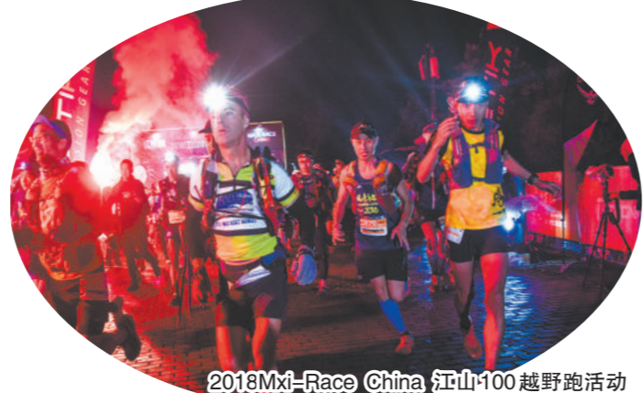
2018Mxi-Race China 江山100越野跑活动

在全域旅游示范市(区)创建中,江山坚持不单单为创建而创建,而是通过创建,引导全市力量化解一批发展难题,以充足的内生动力加快推进旅游产业加速发展。如今,举全市之力并坚持以文化驱动、创新引领开展国家全域旅游示范区创建,江山走出了一条“低成本可复制、长效化可坚持”的富有江山特色的全域旅游发展之路,为全面打造全国一流休闲旅游目的地夯实了坚实基础。