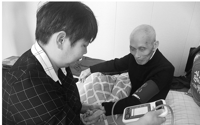
“劳模信使”为劳模量血压。

破,不断壮大高素质产业工人队伍,逐步形成培育体系更加完善、队伍结构更加优化的工匠人才梯队,助推江北高质量发展。 当天,江北区总工会决定将每年“五一”前一一周设立为“劳模工匠周”,通过一周时间,开展劳模工匠宣传、展示、表彰等一系列专题活动,形成人人学习劳模工匠、人人争当劳模工匠的良好氛围。 据了解,自2017年以来,江北区总工会在全省率先启动产业工人队伍建设,并于2019年制定下发了《新时代江北产业工人队伍建设改革实施方案》。同年11月,江北区被列为浙江省推进新时代浙江产业工人队伍建设改革试点县(市、区),12月,被列为全市唯一一个浙江省新时期建筑产业工人队伍培育试点区。活动当晚,江北区总工会还表彰首批15名“智工名匠”。