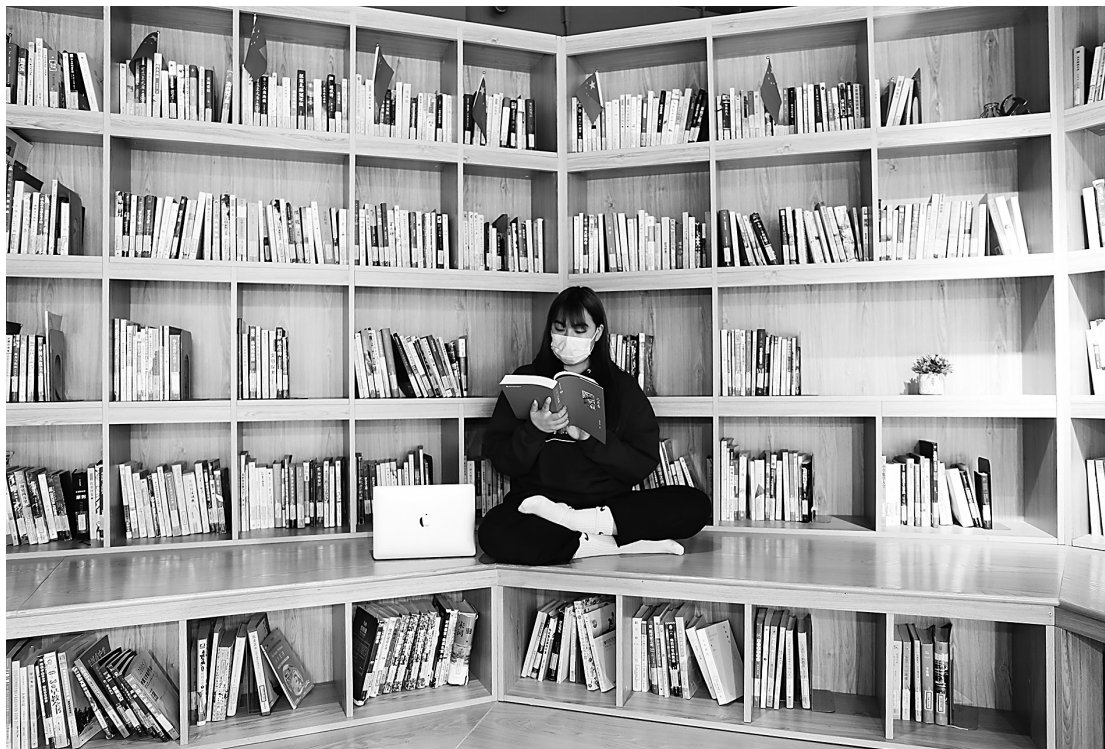
2017年以来,湖州市启动“城市书房”建设项目,至今已在城区建成具备公益借阅、自助服务、场馆体验的城市书房33个,基本形成城市居民“15分钟阅读圈”。图为2月20日湖州市城图广场城市书房一角。