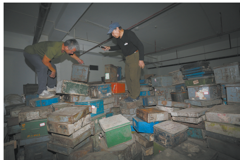
“康城老电影”挑选老拷贝。