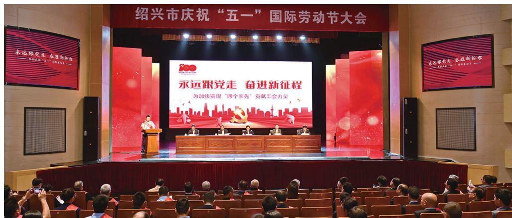
绍兴市庆祝“五一”国际劳动节大会

首批校内劳动基地名单，绍兴市北海小学教育集团茆芑实践基地等25家校内基地入选。基地通过设置各类特色劳动课程，将尊重劳动、热爱劳动、辛勤劳动、幸福劳动的劳动价值观传导给每一位同学。作为市总工会开展“我心向党·劳动创造幸福”主题宣传教育活动的内容之一，助力“双减”工作的一项重要举措，校内劳动基地建设有助于深化劳动教育意识、丰富劳动教育形式、提升劳动教育成效。