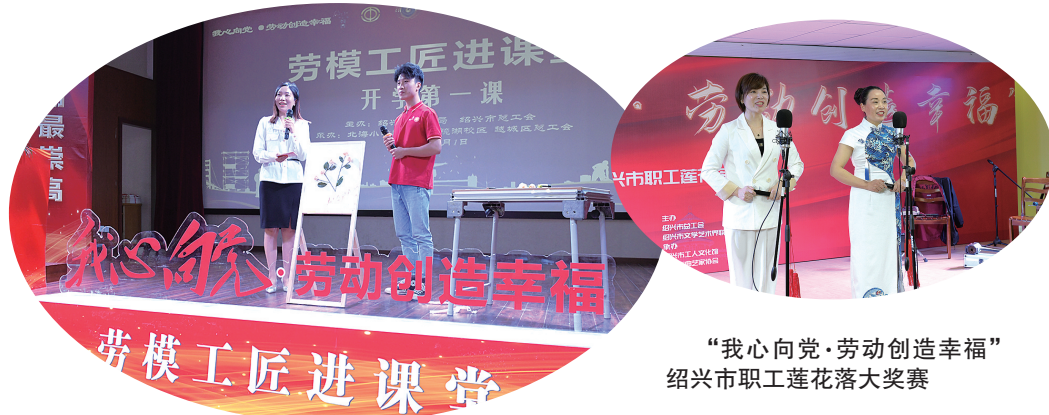
“我心向党·劳动创造幸福”绍兴市职工莲花落大奖赛