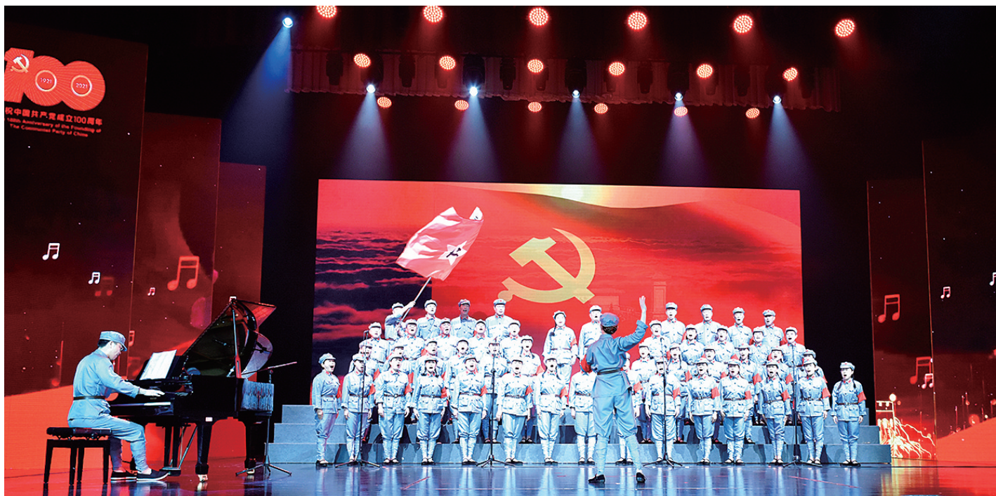
“我心向党·劳动创造幸福”全市职工合唱赛火热唱响