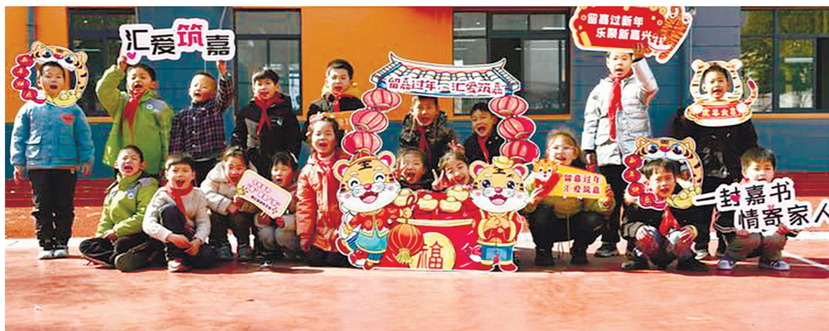
1月11日,“万封家书传亲情”志愿服务走进嘉兴禾新实验学校(平东校区),来自该市青少年宫的摄影志