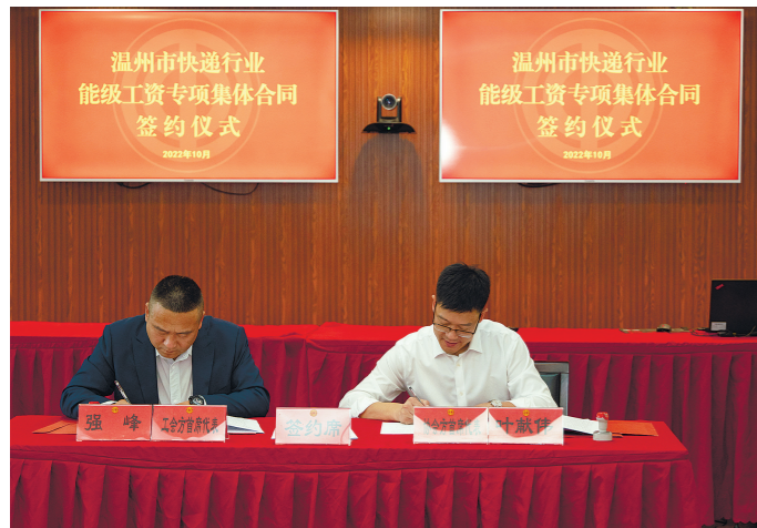
签约仪式现场。

本报讯 记者邹伟锋报道 “这份集体合同的签订,意味着全市154家快递行业公司,2.3万名‘快递小哥’有了职业保障。”近日,温州市首份快递行业能级工资专项集体合同签订。温州市总工会权益保障部部长曾刚毅坦承,历时5个多月,从无到有,再到合同的正式签订,一颗悬着的心终于落地。据悉,这也是全省设区市首份新就业形态劳动者签订的集体合同。 如何有效推进新就业形态能级工资集体协商工作,一直是温州市总工会致力共同富强的先行示范区建设关注的焦点。“5个月来,我们摸着石头过河,通过与人社、邮政、行业协会等多次会商,最终实现将新就业形态劳动者能级工资写入专项集体