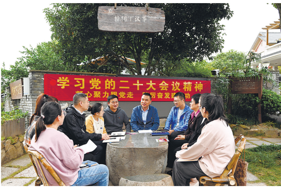
径山镇总工会的工会干部们在大樟树下学习党的二十大精神。

本报讯 记者李凡报道 “要深入学习贯彻党的二十大精神,不断强化工会组织的政治性、先进性和群众性,让党的新时代建设蓝图走进千家万户,团结引领广大职工群众坚定不移听党话、跟党走。”近日,杭州市余杭区径山镇总工会的工会干部们围坐在小古城村村口的大樟树下学习党的二十大精神。