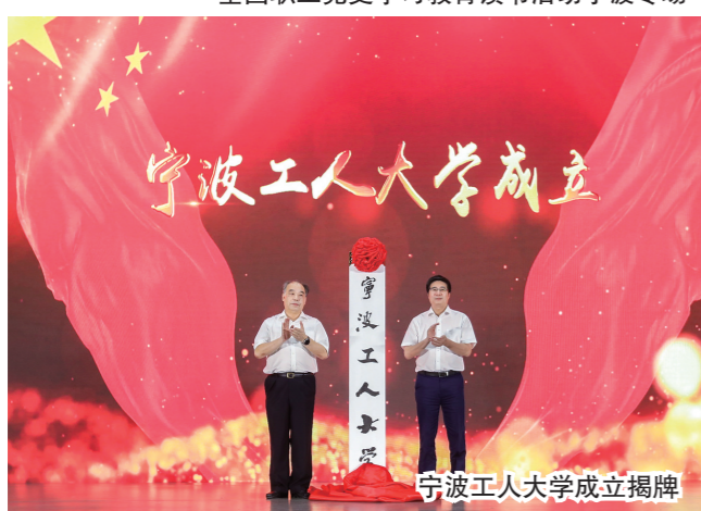
宁波工科大学成立揭牌