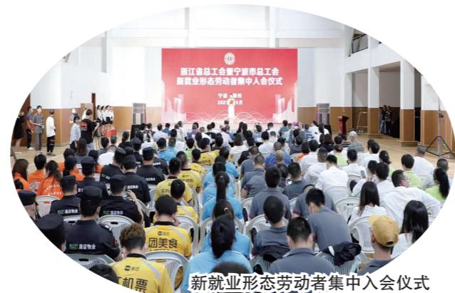
新业态形态劳动者集中入会仪式

职工在哪里，工会建就在哪里。工会组建，既是工会的使命和责任，也是为职工提供各类服务保障的基础。 五年来，宁波市总工会牢固树立基层导向，激发工会组织活力，基层工会组织建设成效显著。聚焦“三新”领域八大群体，市级成立物流快递、房产中介、医养照护等行业工会，县级创新“车轮上的工会”“舌尖上的工会”“产业链上的工会”等模式，全市实名制数据库涵盖工会组织2.1万家、工会会员303.9万人，其中新业态工会629家、新就