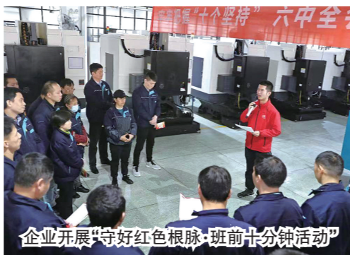
企业开展“守好红色根脉·班前十分钟活动”

维护新业态劳动者劳动保障权益实施办法》等90余项涉及职工切身利益的法规政策文件的制定修改。 健全劳动关系三方协调机制，高标准落实全总、最高人民法院试点任务，劳动争议调解仲裁联动化解模式成为全国样板，8个案例列入全总和最高法工作指南，全省现场会在宁波召开，全市107家工会劳动关系调处工作室累计调解劳动争议案件9400件，接受法院、仲裁移交案件4443起，调解成功率达83%。 和谐企业（园区）创建、工会社会组织联系引导、普法宣传等工作持续走在全省前列，工会劳动保护全面加强，“安康杯”竞赛实现乡镇（街道）全覆盖，有效维护职工安全健康权益。