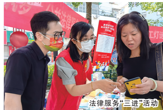
法律服务“三进”活动