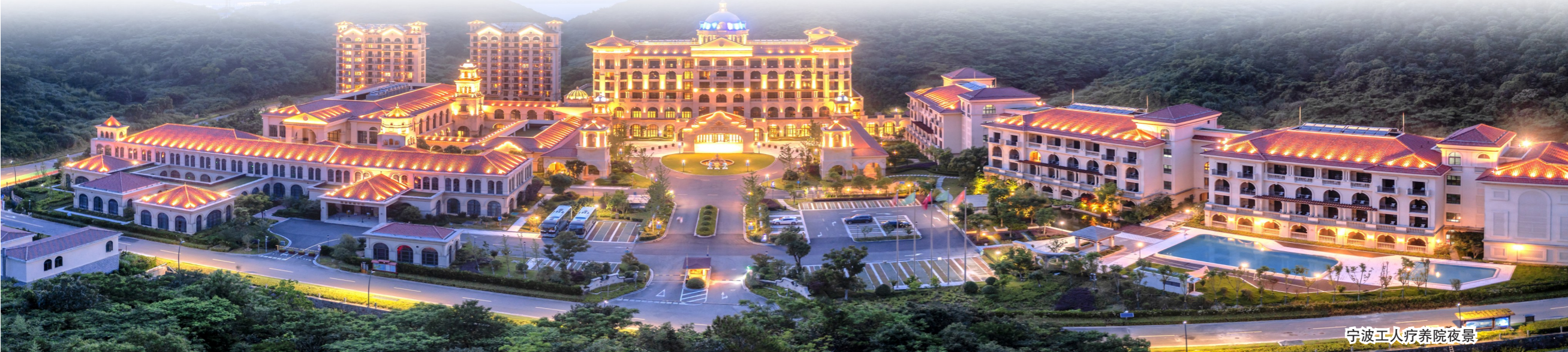
宁波工人疗养院夜景