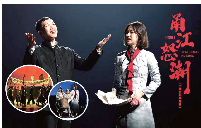
大型原创话剧《甬江怒潮》演绎宁波版《觉醒年代》

“产改”工作标准，列入省级试点数量居全省首位，全省现场会2次在宁波召开，宁波港集团入选全总深化“产改”专项行动十大产业百家企业。 为贯彻落实新发展理念，工会先后组织的“建功十三五”“当好主人翁、建功新时代”等主题劳动和技能竞赛，吸引了1700多个重点工程项目、8000多家企业踊跃参与，带动百万职工在推动高质量发展中勇立潮头。与此同时，5000多场各级各类精英赛群英赛和企业技术比武带动超50万人次职工参与。 新时代宁波工匠培育工程也在逐步实施中。五年来，宁波工科大学挂牌成立，1841名先进获得了“浙江金蓝领”、市级以上工匠、首席工人、技术能手等荣誉头衔，省级以上劳模工匠创新工作室数量居全省第一，产生技术革新成果近万项。 疫情防控期间，2万余名工会干部和工会志愿者前赴后继参与战“疫”，共筹措资金物资2000余万元，慰问基层单位3.2万家、一线人员70余万人次。