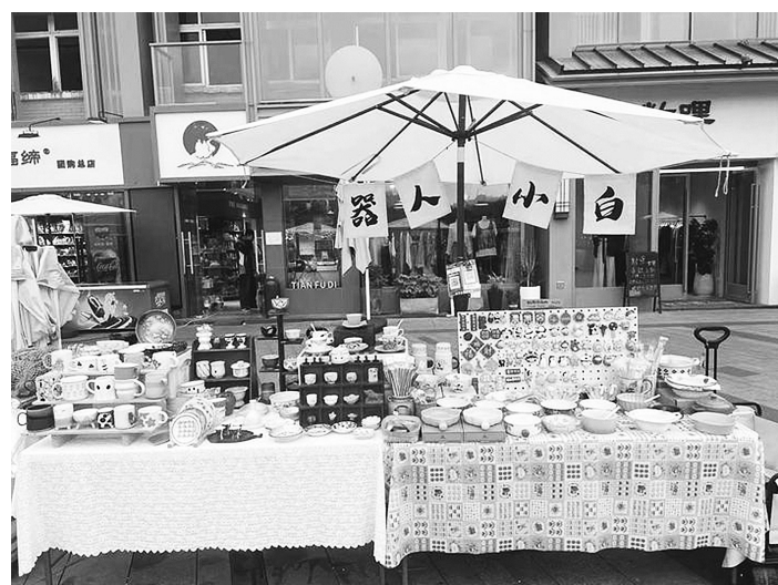
“机器人小白”的部分瓷器。