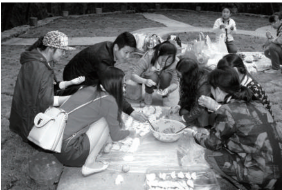
现做现烧现吃,味道可好了。

一直说要去烧烤一次,本来说好是秋天去,可是难得凑齐了人数,天却下起雨来了。于是一拖再拖,直挨到这个冬日的某个双休日,才终于组织了群里帅哥美眉近20人,赴舟山定海岑港老塘万花谷进行了一次野炊活动。 万花谷靠近舟山连岛大桥,从老塘公交站下车进去,乡间小路,曲径通幽,似是峰回路转,柳暗花明。不多时,绕过斜坡便豁然开朗,山谷中的一方平地犹如世外桃源般呈现在眼前。