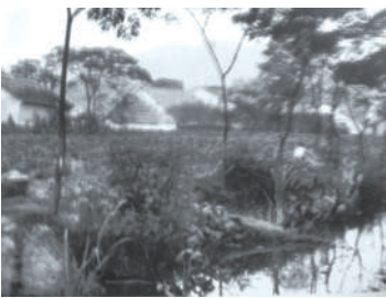
上世纪60年代初的余杭农村一景。