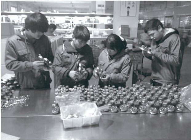
学生在师傅指导下检测表阀。谁是师傅?女的。