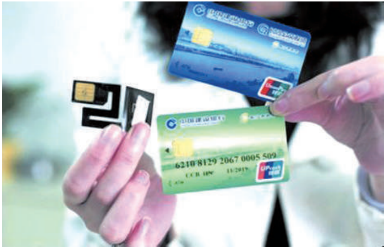
■新华社“新华视点”记者杜放 罗政

根据央行部署,从今年起我国多数商业银行不再发行磁条卡,新开户全面改用芯片卡。这就意味着,储户手中多达34亿张的已发行磁条卡迎来全面“换芯”。