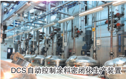
DCS自动控制涂料密闭化生产装置