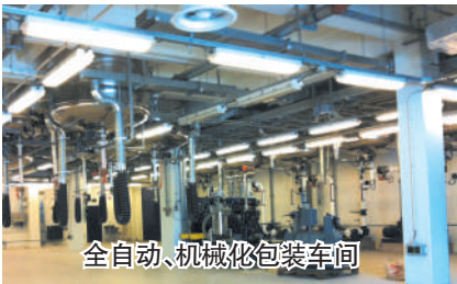
全自动、机械化包装车间