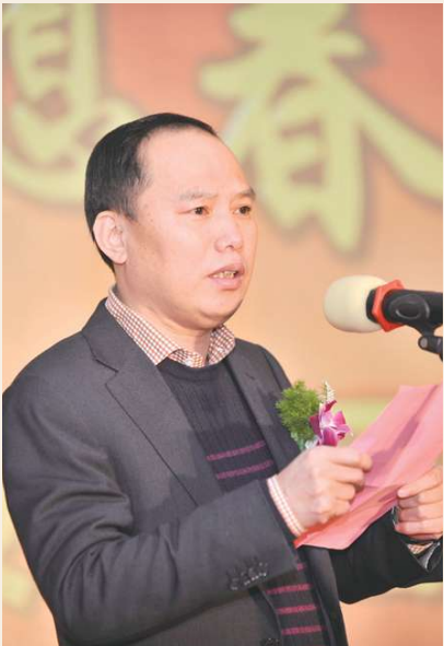
劳模名片: 浙江正大控股集团有限公司 董事长 全国劳动模范