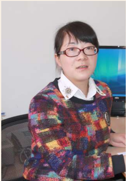
劳模名片: 工会主席 杭州天道实业有限公司 全国劳动模范