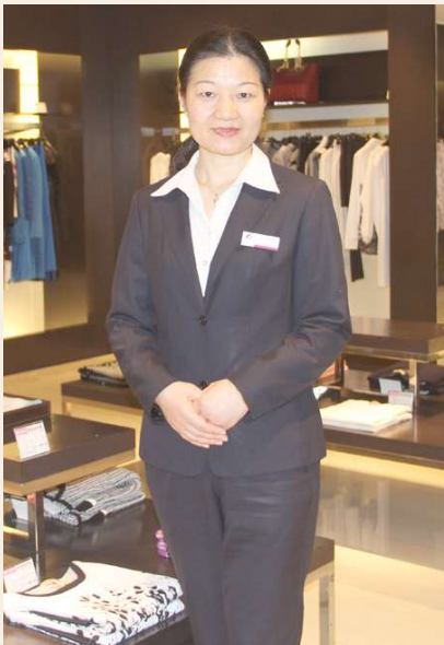
劳模名片: 杭州解百集团 营业员 全国劳动模范