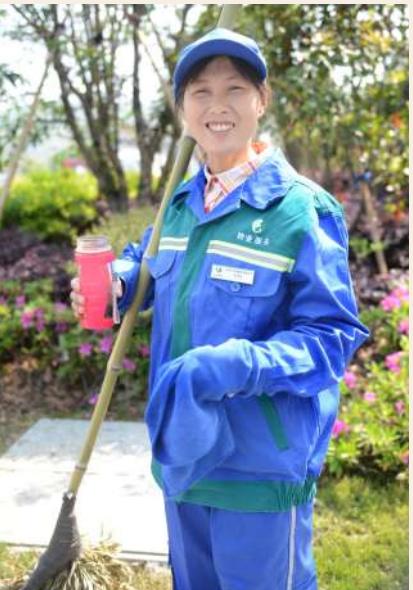
劳模名片: 杭州市场环境集团 保洁员 全国劳动模范