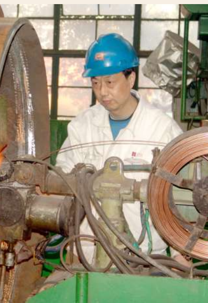
劳模名片: 杭州锅炉集团股份有限公司 自动焊班班长 全国劳动模范