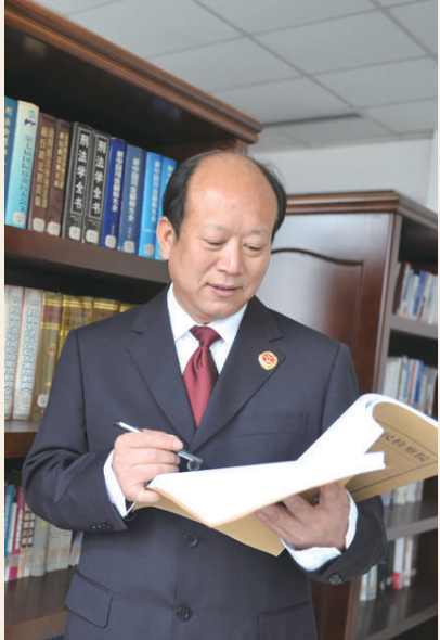
劳模名片： 衢州市人民检察院检察员 全国劳动模范