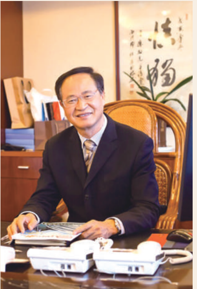
劳模名片： 衢州东方集团总裁 董事长 全国劳动模范