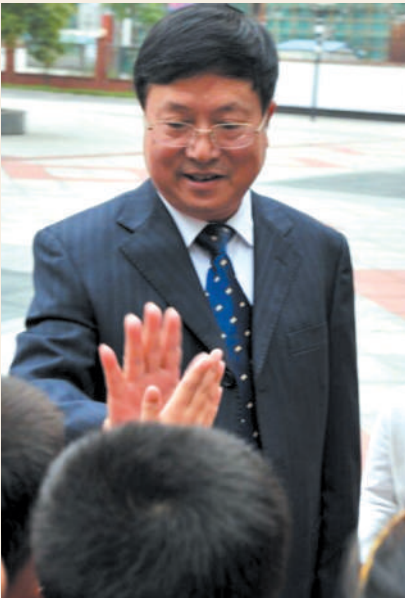
劳模名片： 金华师范学校附属小学 全国先进工作者