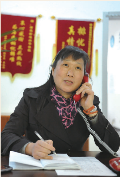
劳模名片： 衢州市柯城区兰花热线 全国劳动模范