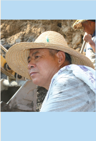
劳模名片： 龙游县大街乡贺田村党 支部副书记