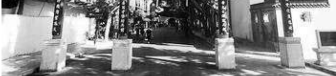
江南贡院是中国历史上最大的科举考场，可同时容纳20644名考生参加考试。它位于南京，是夫子庙地区主要建筑群之一。

条条大路通罗马，考试只是一种手段，只要以平常心认真对待就可以了，无需背负太重的压力。