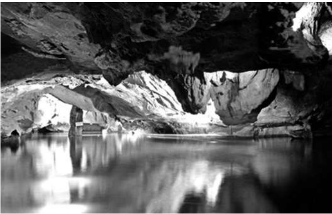
令人神往不已的垂云通天河

垂云通天河，光听这大气磅礴、充满意境的名字，就已经令我们神往不已了。那个双休日，当我们怀着探奇览胜的心