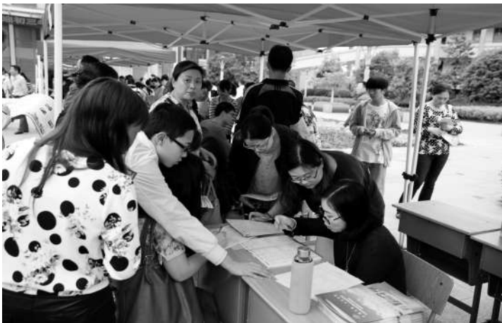
■通讯员包晓明 文/摄

近日,宁波镇海职教中心举行2015年招生现场咨询会,当天,千余名学生和家家长蜂拥而至,参与现场咨询活动。不少考生和家家长看好职业教育,其中包括有把握考上普高的考生。从咨询现场