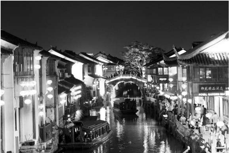
夜色下的千灯古镇,犹如一位娴静的美少女。

跨过几座明清时期的环形石拱桥,沿着千灯浦那条依河而建的长廊信步走来,已经有月色漂在河心里,