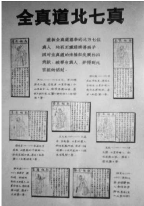
重阳宫中的图板,中间的小图为丘处机最权威的图像。