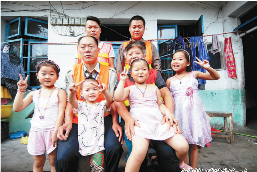
全家福里唯独缺了父亲

“到了天黑的时候不见他回来,随后,我们发动了亲戚朋友、村里10多个人,到河边、池塘边、水井边、附近村庄、车站,四处寻找,接连找了三四天也没有找着他……之后,他再也没回家了。”