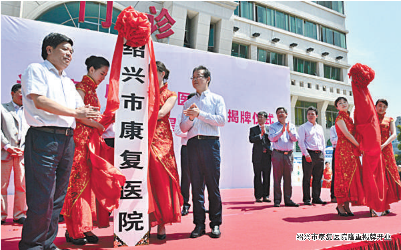
绍兴市康复医院隆重揭牌开业

残疾人事业是高尚的事业，是社会文明进步的重要标志。让我们大家携起手来，为推进残疾人事业，为加快建设经济繁荣、生活富裕、风尚文明的现代化绍兴而共同努力！