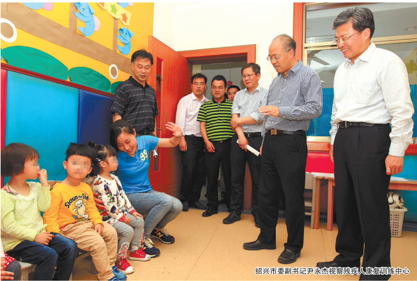
绍兴市市委副书记尹永杰视察残疾人康复训练中心