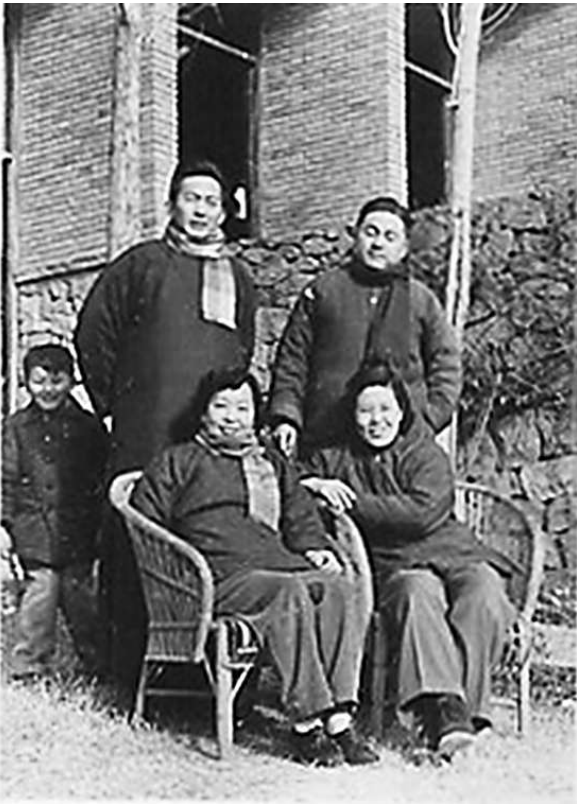
图①:老底子的照片,左小孩为作者。