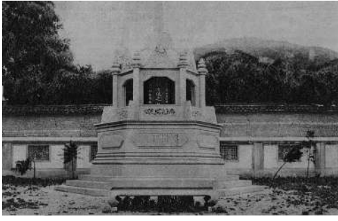
图④:二十世纪的二十年代的孤山秋瑾墓