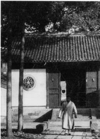
图⑤:20世纪10年代的风林寺。现在这个位置成了杭州香格里拉饭店

自此之后,那幢房子晚上漆黑一团,从不见灯光;白天也不见有人进出,小朋友们没人敢到那个地方玩。由此,多少让人敬而远之。