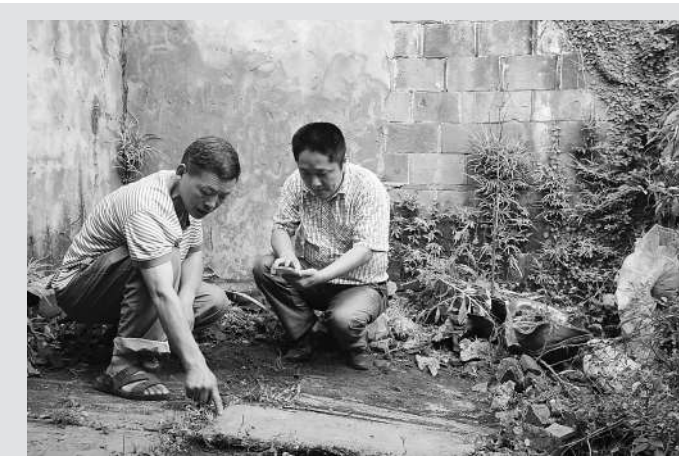
常山热心市民在东淤辨认抗日勇士墓碑

笔者在现场看到,裸露在土外的墓碑为青石材质,长约60厘米,宽约40厘米,5厘米厚。拂去尘土,清洗墓碑后,笔者看到,碑头用大号字体镌刻着“抗日伤亡”字样。在3块完好的墓碑上,分别用小号字镌刻着:“民国二十七年十二月病亡,五一师三零五团三