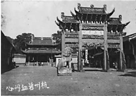
图②:岳庙的老照片,照片上书“杭州碧血丹心”,是杭州人的一份心情。

走廊的一边是荷塘,另一边是一个类似中式祠堂大厅,记忆中只有较大型集会时才偶尔用一下。雨天或下课后,小朋友便将这个地方当作操场用,过了大厅有一个操场,这个操场一面靠着祠堂大厅,三面用竹篱笆围着,里面有篮球架,还有个小小的沙坑。上体育课,同学们在操场上玩篮球,或者跳远。每天早操也在这里。早操后,校领导会在台上训话,小朋友们规规矩矩地在下面聆听。