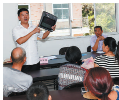
村工会刚成立,县、镇总工会马上送来“福利”。为村里农家乐普及并安装网络电子商务终端,把村里的农家乐生意做到互联网上去。

昨天上午,淳安县千岛湖镇屏湖村召开农家乐联合会成立大会。在淳安县总工会、千岛湖镇党委、工会的指导下,屏湖村28户经营农家乐的40位职工代表庄重地投下手中选票,依法选举出了首届工会领导班子,成为淳安县第一个建立基层工会组织的行政村。这标志着淳安县总工会从今年3月起开展的“三级工会联动,共助千岛湖健康养生产业发展”,推进工会工作覆盖的专项行动落到了实处,乡村农家乐也有“职工之家”了。