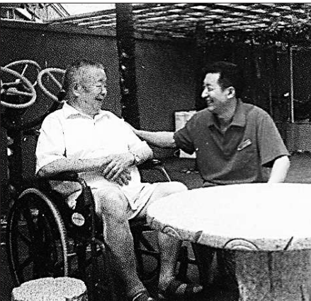
养老护理员:老人开心,我也开心。

功举办了3次。每一次比武,都有力催生了一部分高级养老护理人员,并且带动一大批养老护理员开展学技术,比技能,营造出了很好的内部学习和比拼技能的氛围。