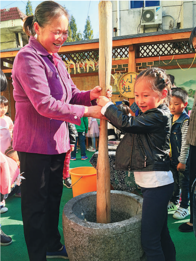
10月19日,临安市岛石镇中心幼儿园开展“体验民俗迎重阳”主题教育活动,小朋友们和爷爷奶奶们一起打麻糍,体验民俗文化,迎接重阳节的到来。