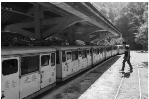
踏上黄金之旅,做回掘金美梦。