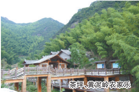
茶坪、黄泥岭农家乐