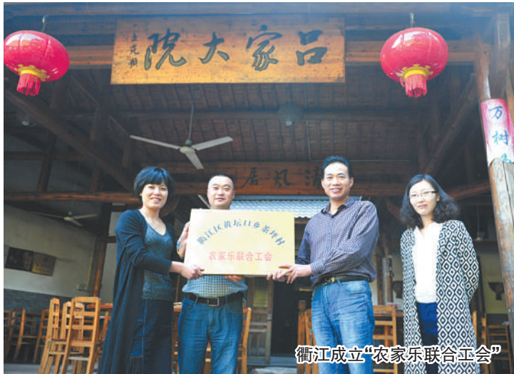
衢江成立“农家乐联合工会”