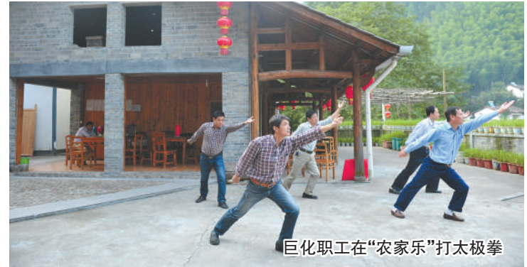
巨化职工在“农家乐”打太极拳

江大地上的一切生物。经过瑞士专业的水质监测公司SGS的检测，有29项指标均优于国家一级地表水。来衢江，春可听雨观瀑，夏可亲水游泳，秋可访云探瀑，冬可踏雪赏冰。