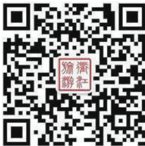
衢江旅游服务号微信二维码

级以上资源27处，海拔千米以上的山峰7处，这里有关公山、药王山、古树群、古民居、马尾瀑布、仙人居等，旅游资源丰富、禀赋优良，山险奇、林瀑壮观、溪谷幽长，有山、溪、河、瀑、湖、泉、洞、石等多种类型，且量大面广。景区自然景色清新怡人，植被丰盛，风景秀丽，环境优美，气候宜人，拥有大量的珍稀特种，有300年的红豆杉、白豆杉、枫树、500年的罗汉松、樟树、香果树等一批古树名木，森林覆盖率高达98%，是得天独厚的天然氧吧。