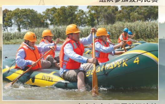
在水上中心开展防汛演练