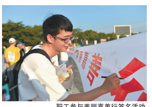
职工参与美丽嘉善行签名活动