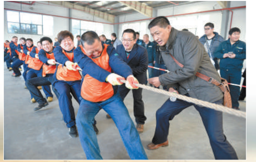
组队参加拔河比赛