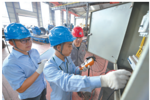
对危化企业进行用电检查