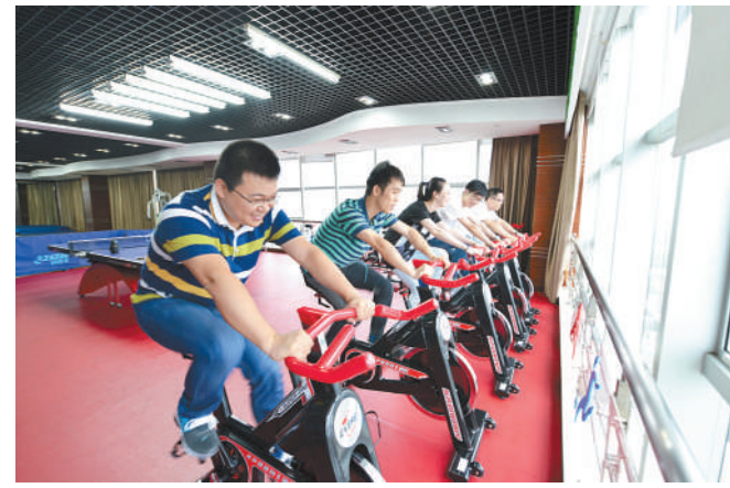
在“文体活动室”健身