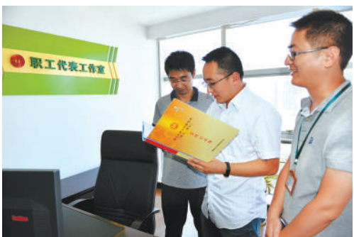
职工代表在职工代表工作室开展工作讨论