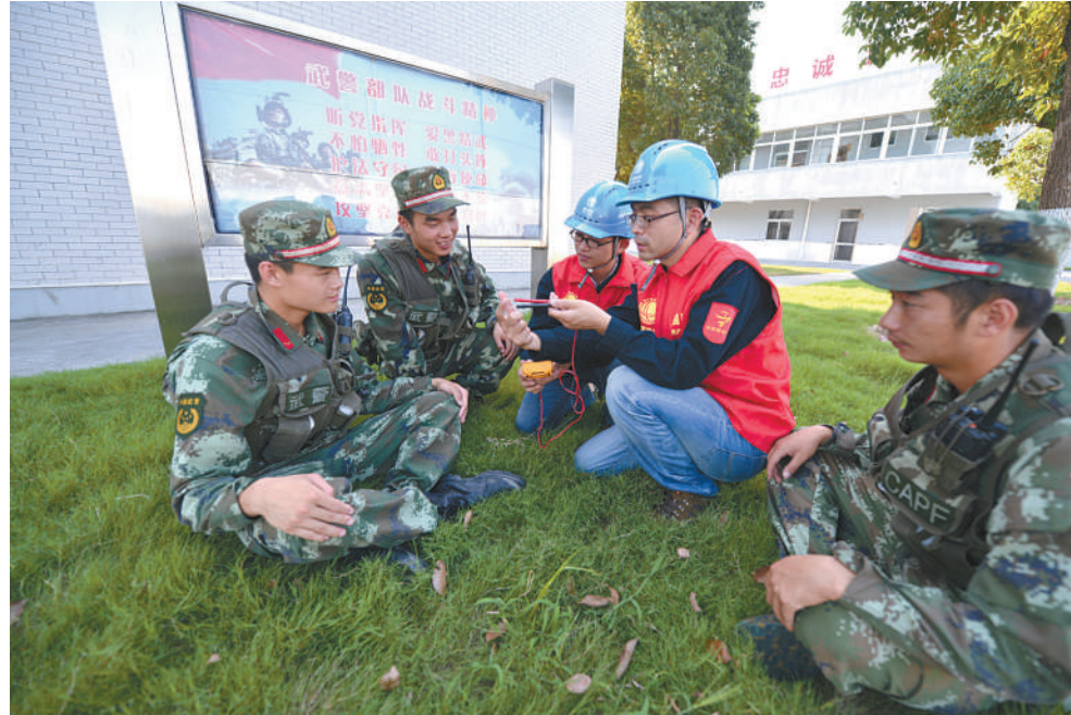
进军营宣讲安全用电知识