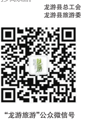
“龙游旅游”公众微信号