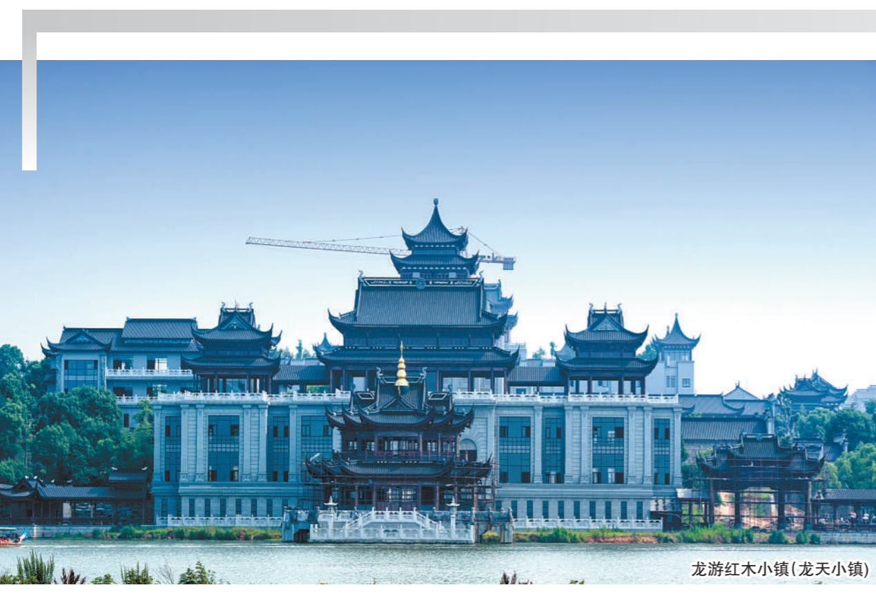
龙游红木小镇(龙天小镇)

没有黄山的雄伟瑰丽,也没有三清山的秀美灵动,但却有着独特的美:层峦叠嶂,千峰争秀,素享“小武当”美称的真武山;巨石匝城,宛如巨狮醒睡的乌石山;池水终年不会干涸,传说是仙子遗落在人间的天池山……这里山石如黛,蓝天如洗,翠竹如荫。让我们卸下城市生活之重,肆意享受山间美景。 宿在农家,品味一杯山茶,享受“采菊东篱下,悠然见南山”的惬意,这里的乡村让人流连忘返。到那些农家客栈小住几晚,定有不少的收获与满足。