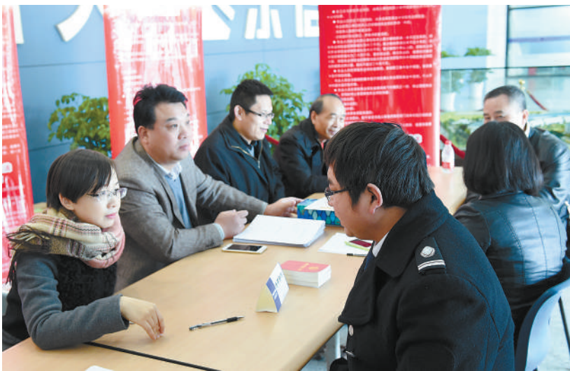
省总工会工作人员进企业解答职工咨询,普及劳动法等法律常识。

除了法律讲座,省工会系统还为职工提供法律咨询服务。记者现场看到,法制宣传海报图文并茂,引人注目。法律咨询台围满了前来咨询的职工,法律读本、宣传册免费发放。