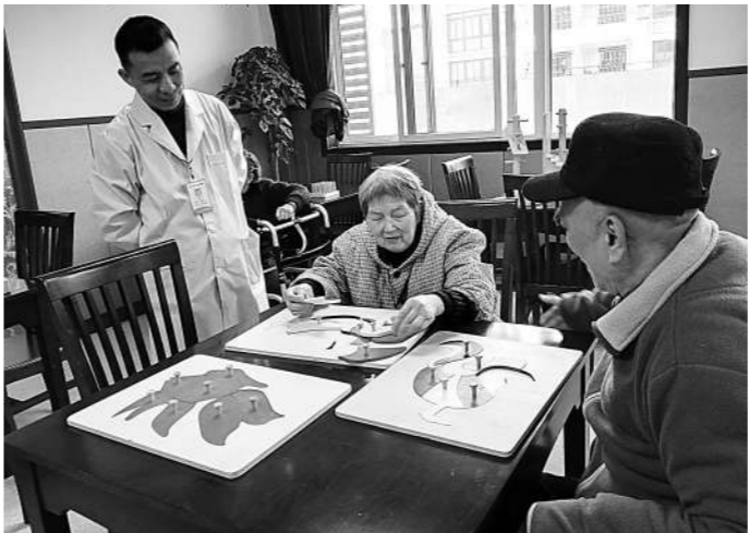
老人在进行益智训练。

日前,记者随同省养老机构星级评定考评组实地评审了绍兴市社会福利中心和社会福利院两家养老机构,现场检查了两家参