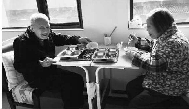
▲两位老人在阳光普照的房间内享用“你点我供”的午餐。 ►养老机构处处为老人着想,电梯门是玻璃可视的,电梯内还特意安装了安全座椅。