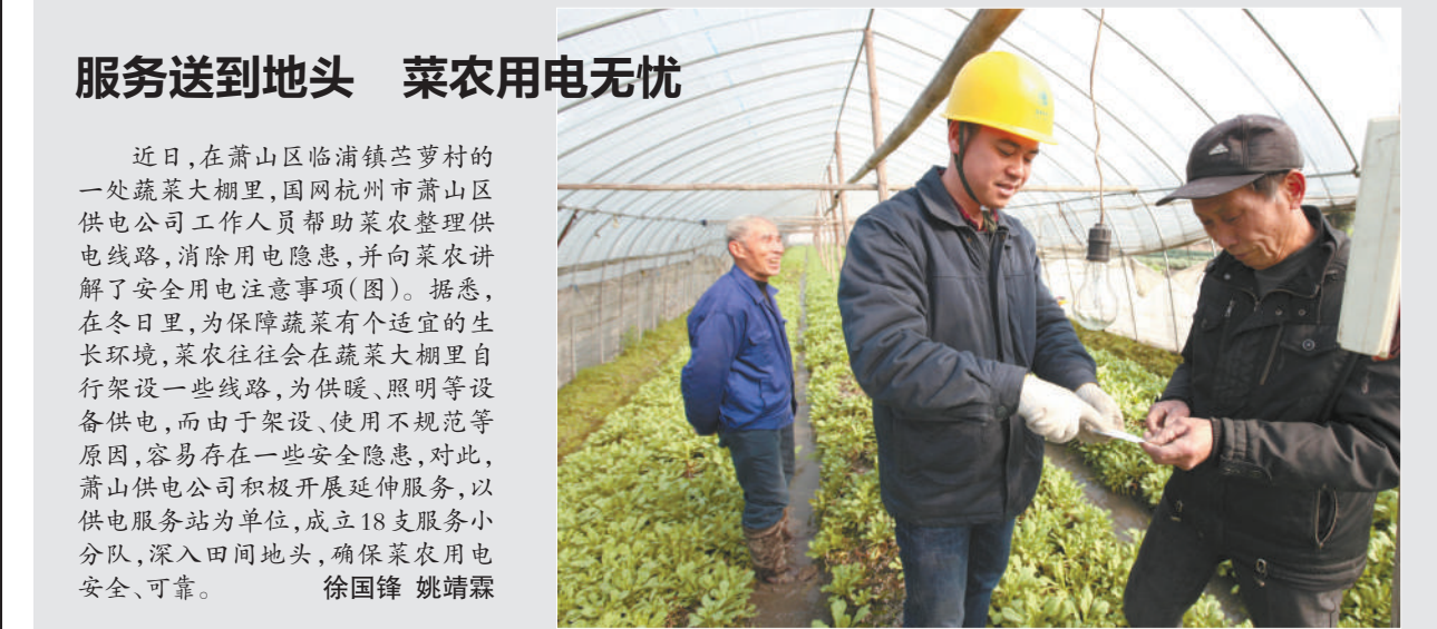
近日,在萧山区临浦镇苕萝村的一处蔬菜大棚里,国网杭州市萧山区供电公司工作人员帮助菜农整理供电线路,消除用电隐患,并向菜农讲解了安全用电注意事项(图)。

据悉,在冬日里,为保障蔬菜有个适宜的生长环境,菜农往往会在蔬菜大棚里自行架设一些线路,为供暖、照明等设备供电,而由于架设、使用不规范等原因,容易存在一些安全隐患,对此,萧山供电公司积极开展延伸服务,以供电服务站为单位,成立18支服务小分队,深入田间地头,确保菜农用电安全、可靠。