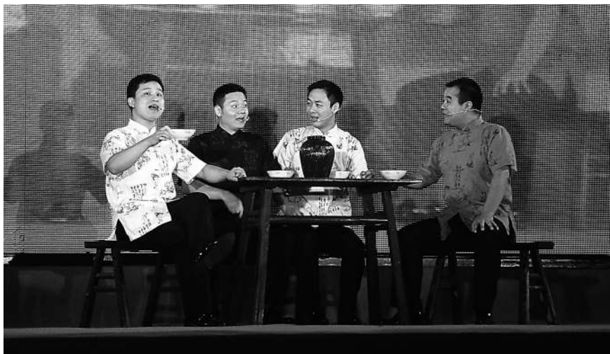
喝一碗状元红 享几多人间乐