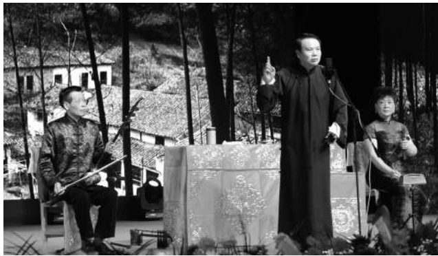
说唱的艺术——莲花落演出剧照