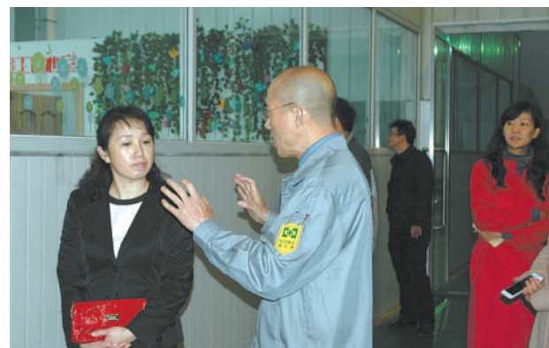
省外工会组织来海宁考察学习