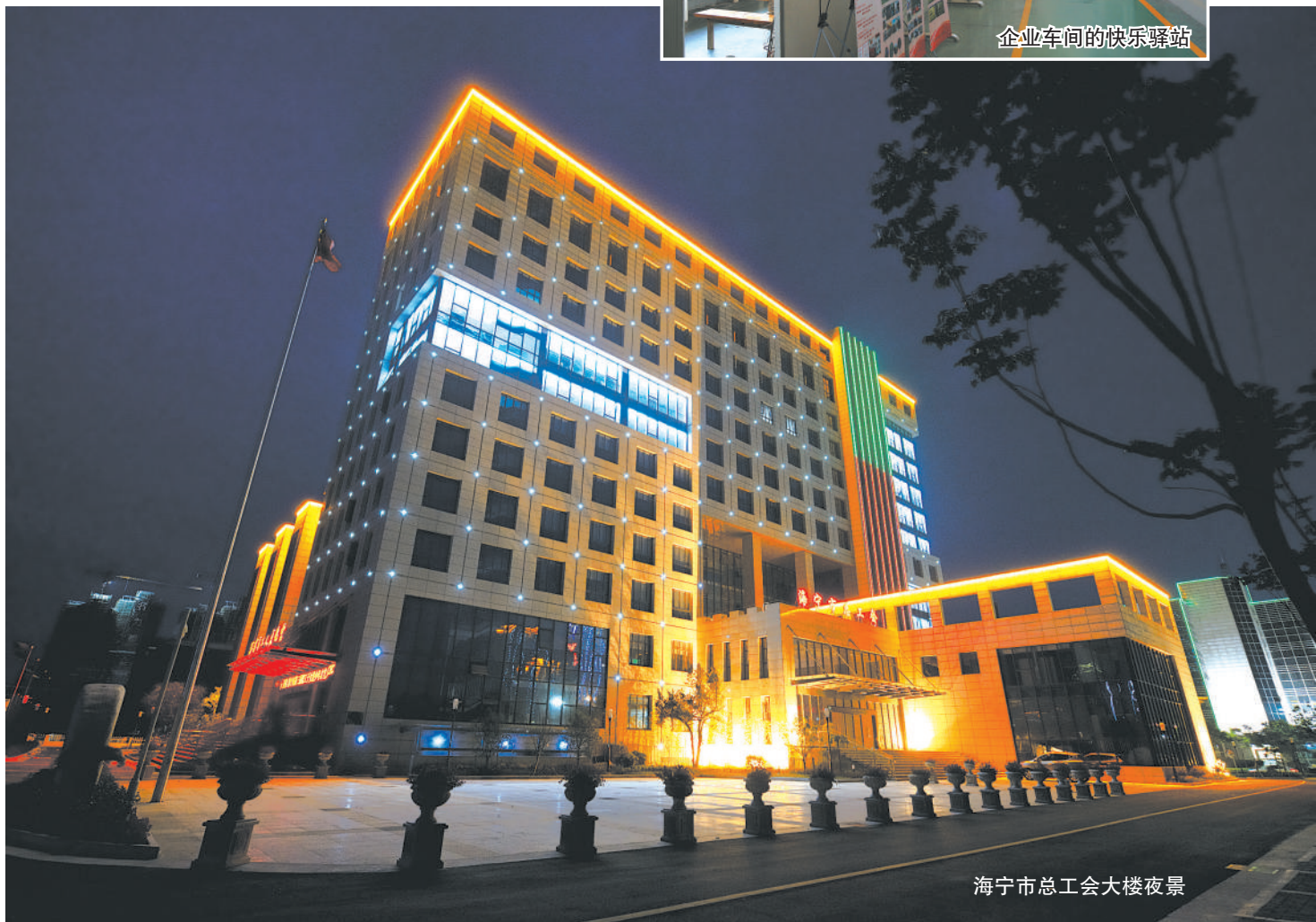
海宁市总工会大楼夜景