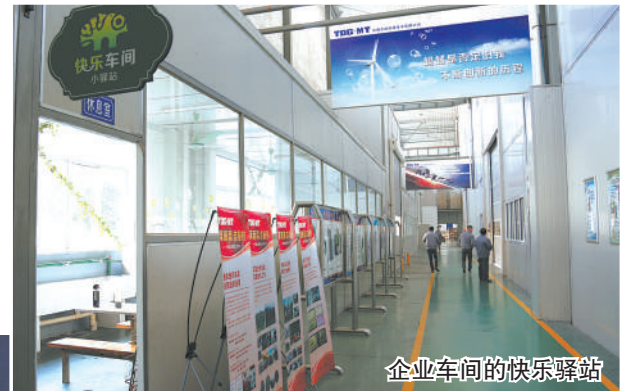
企业车间的快乐驿站