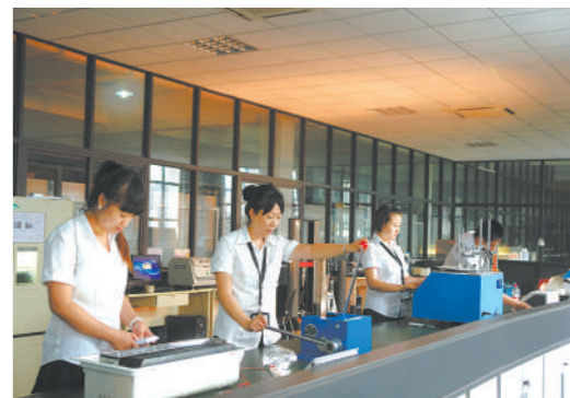
鼎美公司检测中心