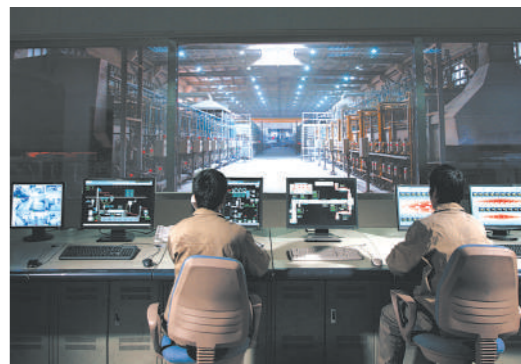
振申绝热数控车间