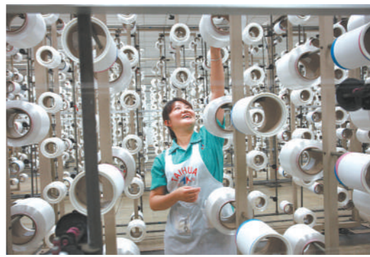
龙源公司纺织车间一景