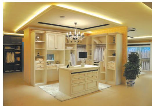
鼎美集成家居展厅

势地位。代表王店工业特色的这三大产业,还有着异曲同工之处,那就是,三大产业依托产业集群的优势,分别加速了技术的创新与扩散,不断为王店的经济增长提供原动力,推动城镇化的进程。