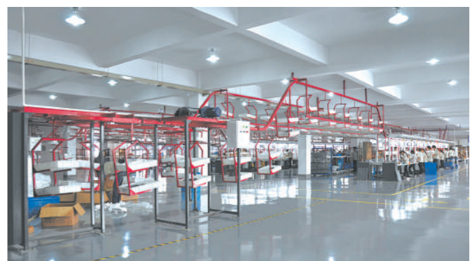
集成吊顶总装车间

如今,王店的产品正逐渐从传统的“家装”向“工装”领域拓展,并且向集成厨卫和集成家居延伸,销售模式也从加盟店走向直营店和电子商务。企业唯有以消费者需求为导向,不断进行产品创新,才能开辟新蓝海。