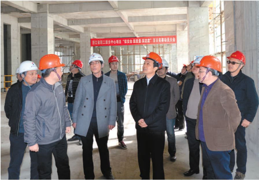
厉志海(图前排右二)在省职工服务中心项目工地7楼楼面施工现场视察。

本报讯 记者周金友报道 2月26日,农历正月十九,省人大常委会副主任、省总工会主席厉志海,专程到杭州三台山庄和浙江省职工服务中心项目工地,亲切看望春节至今一直加班奋战在G20峰会重点项目、浙江省重点建设项目工地上的工人们,代表浙江省总工会向辛勤工作的建设者们拜个晚年。