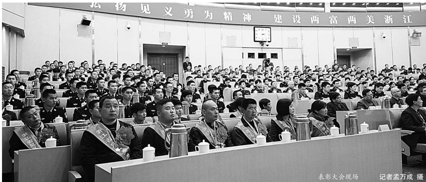
表彰大会现场