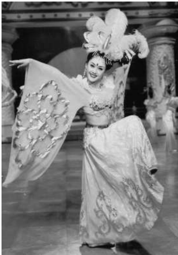
西安仿大唐歌舞《霓裳羽衣舞》