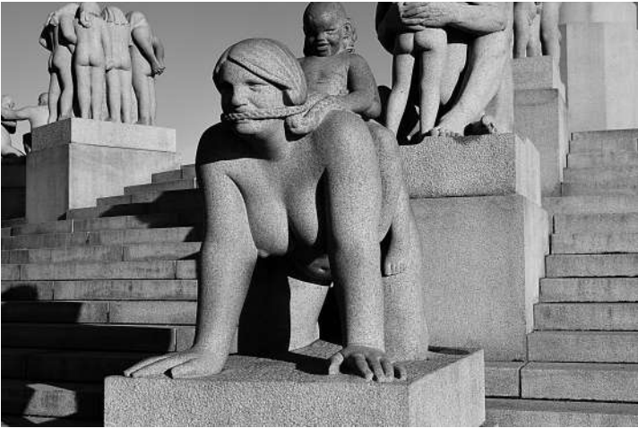
维格兰公园的裸体雕塑一景。

文化差异,标题敏感。国外有不少景象:草坪裸体日光浴,海滨裸体游泳场,街头裸体“行为艺术”,乃至广场裸体集会游行,等等。裸体艺术雕塑,则更不稀奇,司空见惯。维格兰公园的全裸雕塑,场面大,名气大,影响大——布局50公顷,青铜雕、铸铁雕、石雕,214个雕塑群,758个人物,男女老少,全都