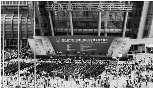
(第六届门博会开幕式盛况)

本报讯 杜志华报道 5月26日至28日,第七届中国(永康)国际门业博览会将在永康国际会展中心举行。作为行业内的知名展会,中国(永康)国际门博会已经举办了六届。